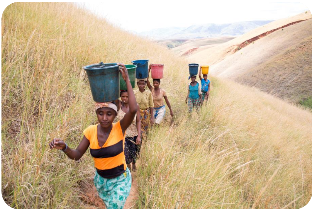
Un groupe de femmes portant de l'eau et gravissant une colline pour rentrer à leur village de Miarinarivo, Madagascar.

L'accès à l'eau potable, des toilettes décentes et une bonne hygiène devraient être à la portée de tous et toutes partout. Actuellement, des millions de personnes en sont privées en raison de leur identité, de leurs revenus, ou de leur lieu de résidence. Ceux qui ne jouissent pas de ces droits humains fondamentaux ne bénéficient pas non plus de l'égalité des chances en ce qui concerne leur santé, leur éducation et leur sécurité financière.