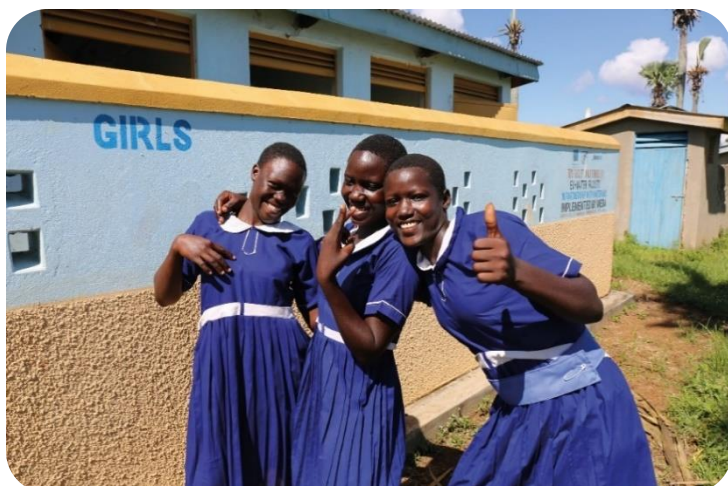
Trois filles se tenant fièrement devant leur bloc sanitaire coloré de leur école Opeta school dans le district de Pallisa, Ouganda.